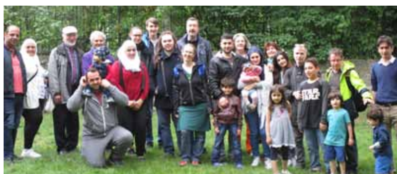
Ausflug mit unseren syrischen Flüchtlingen