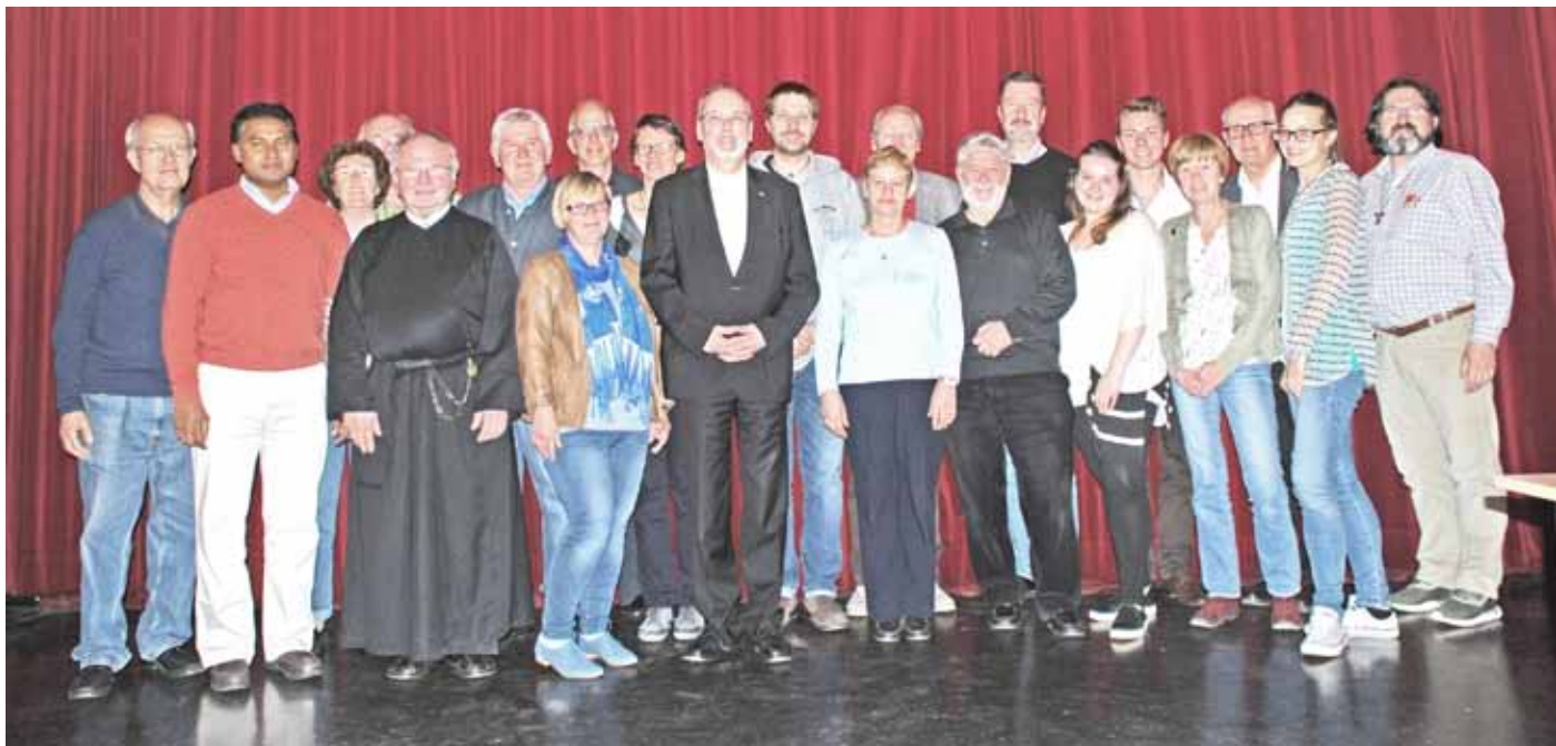
Der neue Pfarrgemeinderat und VVR nach der konstituierenden Sitzung