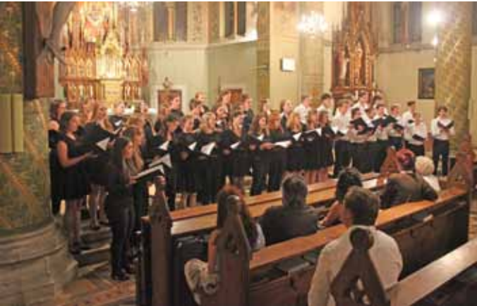
Der große Jugendchor der Volksoper Wien

Das Programm in der Marienkirche stand heuer unter dem Thema „Seele“. Den großen Erfolg verdanken wir der bewährten Leitung und Organisation von Johannes Kirchner und seinen Helfern.