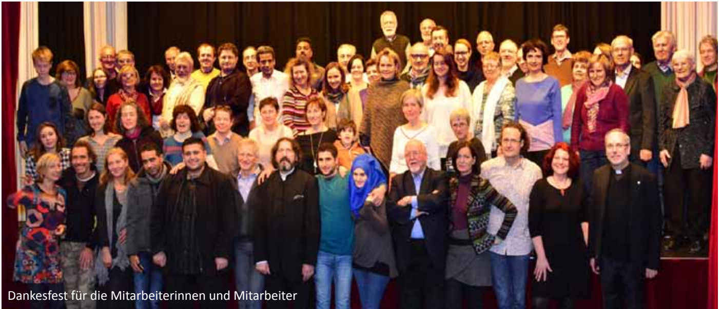
Dankesfest für die Mitarbeiterinnen und Mitarbeiter

Von Anfang August bis Ende Jänner 2016 haben über 13.000 Personen in unseren Räumlichkeiten ein Notquartier, Verpflegung, ärztliche Betreuung und eine herzliche Aufnahme gefunden. Insgesamt über 250 Helfer und Helferinnen waren und sind bei dieser Aktion beteiligt. Ende November wurde im Rahmen eines Festes im Clemens Hofbauer-Saal diesen Helfern gedankt. Einige davon erhielten auch die Ehrenmedaille der Redemptoristen überreicht; auf der web-site finden sich weitere Berichte dazu. Daneben wurden mehreren Familien, welche bereits einen Asylantrag gestellt haben bzw. den Asyl-Status bereits erhalten haben, Wohnungen zur Verfügung gestellt. „Patent“