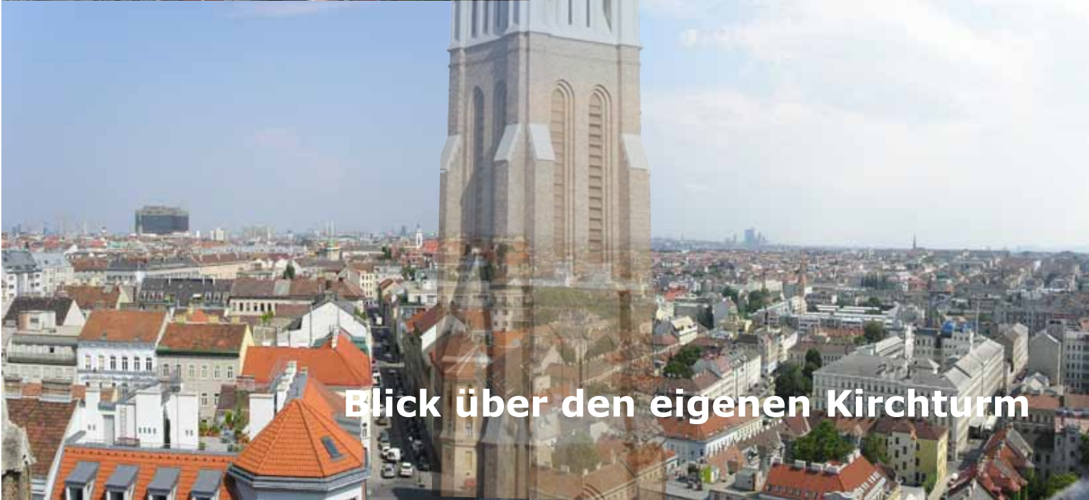
Blick über den eigenen Kirchturm